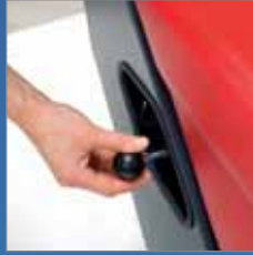
Filterreinigung durch hin- und herbewegen des Hebels.