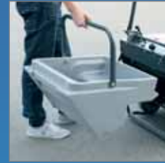
Dieser Schmutzbehälter ist immer im Gleichgewicht und kippt erst, wenn Sie das möchten.