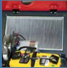
Filter im Innern der Maschine.