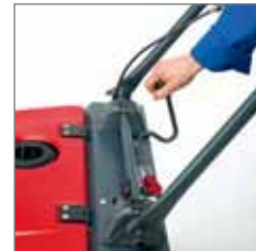
Hebel Seitenbesen absenken / anheben.