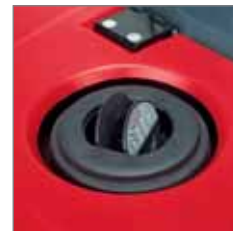
Bypass-Klappe Durch das Öffnen wird die Absaugung unterbrochen. Dadurch kann feuchtes Kehr gut optimal aufgenommen werden.