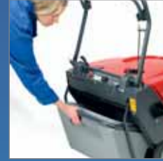
Einfaches Herausziehen des Schmutzbehälters.