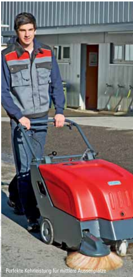
Perfekte Kehrleistung für mittlere Aussenplätze