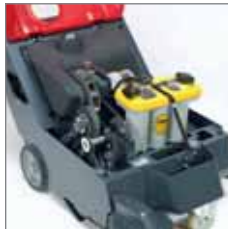
Das Innere der Maschine mit wartungsfreier Batterie.