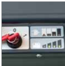
Batterie- und Onboard Ladegerät Anzeige inkl. Tiefentladeschutz. Verhindert komplette Entleerung der Batterie.