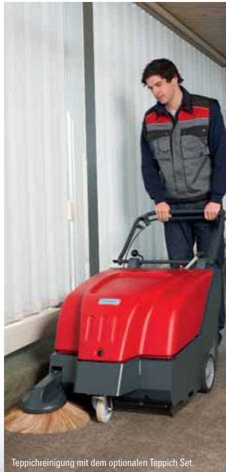
Teppichreinigung mit dem optionalen Teppich Set.