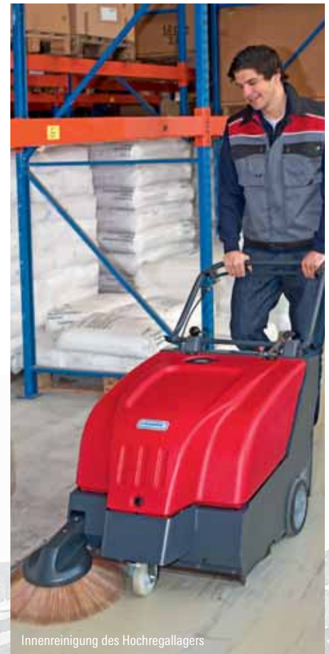
Innenreinigung des Hochregallagers