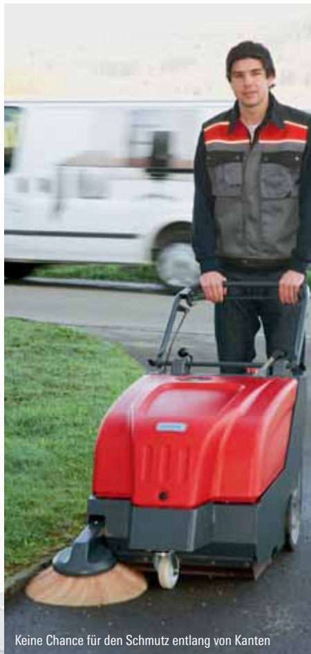
Keine Chance für den Schmutz entlang von Kanten